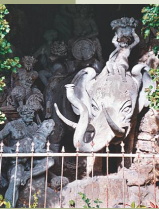
La fontana dell'elefante.

Recapiti: tel. 049/9100411; cell. 329/8391663; fax 049/526946; e-mail: info@castellodelcatajo.it ; sito web: www.castellodelcatajo.it