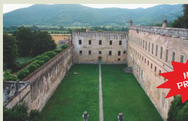
Il cortile dei Giganti.