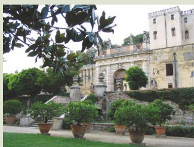
Vista del Castello dal parco delle delizie.

Luigi e Caterina Obizzi ci accompagnano nella visita al castello, ricordano gli ospiti di ieri, dialogano con quelli di oggi e auspicano che le visite possano continuare per un lunghissimo futuro. (Il turismo sostenibile in una dimora storica vincolata all'interno di un'area protetta).