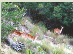
Daini nel parco.