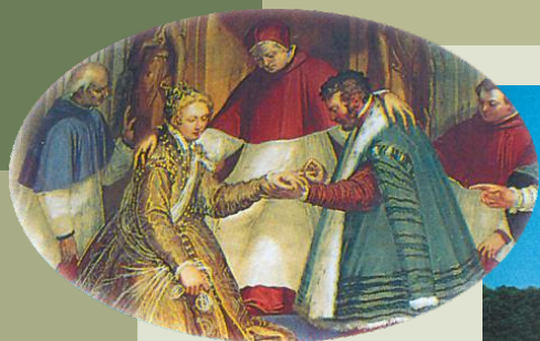
Papa Innocenzo IV Fieschi sposa Luigi Obizzi con la nipote Caterina Fieschi (particolare).

Castello del Catajo - Via Catajo, 1 - 35041 Battaglia Terme (PD)